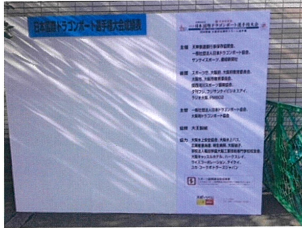
(6) シンボルマーク等の表示が確認できる資料：横断幕・看板